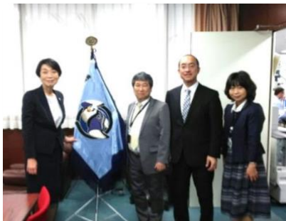
5月15日東京都立大江戸高校へ。 三部制単位制の総合学科。

平成31年度入学者選抜を行う府内公立高校等が一 堂に会して説明会を開催。工業や農業等の専門校の魅 力を発信する産業教育フェアも開催。 日時：7月29日（日）10:00～16:00 場所：インテックス大阪6号館Aゾーン ニュートラム「中心頭」下車