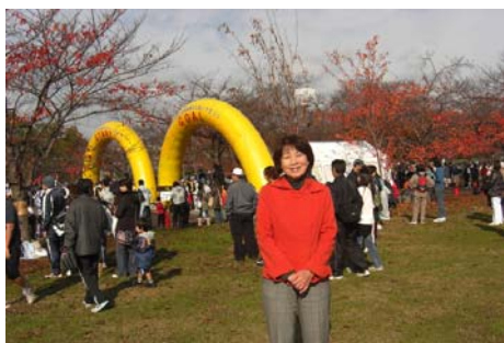
吹田市ふれあいマラソン出発式 万博記念公園東の広場