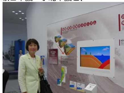
津波・高潮ステーション視察 地下鉄阿波座駅下車