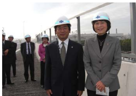
基幹的広域防災拠点視察 堺2区 公明議員団で