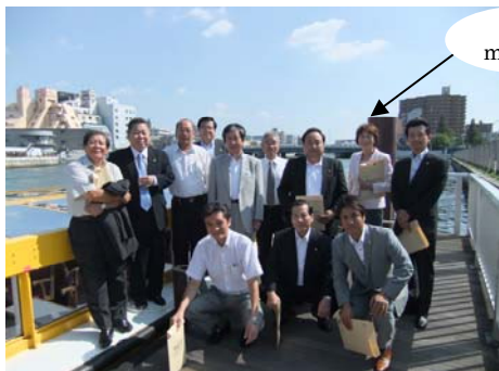
都市住宅常任委員会で水都大阪視察 八軒家船着場~大阪ドーム千代崎港