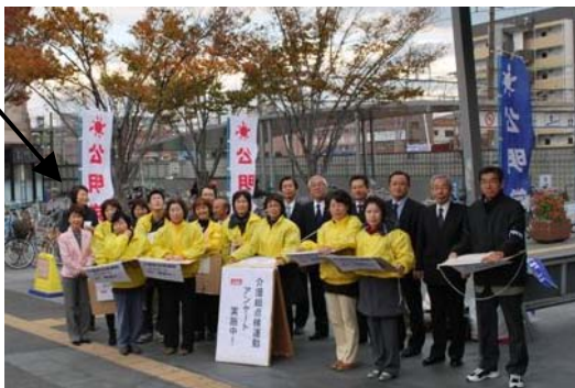
介護の総点検運動でアンケート調査を実施しました。(JR吹田駅北口)